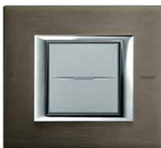
Brushed bronze - BR