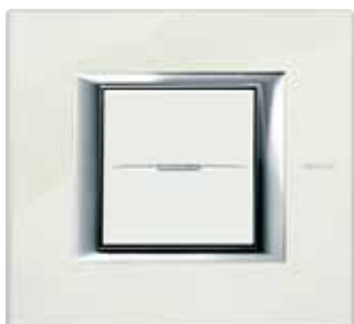
White Limoges - BG