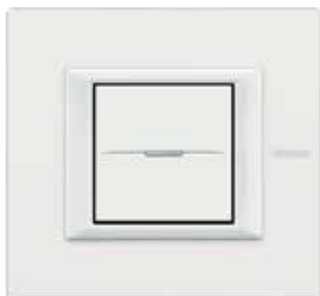
White - HD