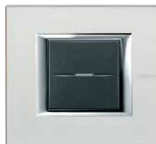
Silver - SAN