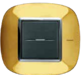
Shiny gold - OR