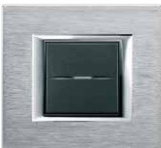
Brushed chrome - CR