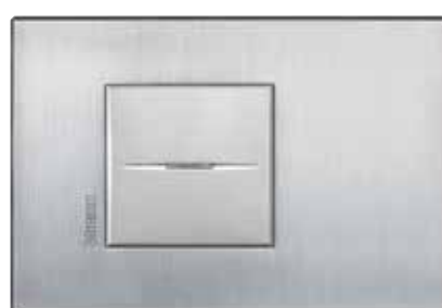
Chrome - CRS

Στις επόμενες σελίδες παρουσιάζονται οι τιμές 24 λειτουργιών: 1) σε πλαίσια Axolute τετράγωνα και ελλειπτικά 2 στοιχείων για συμβατική εγκατάσταση (με βάση στήριξης 2 στοιχείων με νύχια) 2) σε πλαίσια Axolute Air για μηχανισμούς 2 στοιχείων για ειδική εγκατάσταση (με βάση στήριξης 3 στοιχείων με βίδες) Για τις τιμές επιπλέον λειτουργιών ή συνδυασμούς λειτουργιών και τοποθέτηση σε πλαίσια περισσότερων στοιχείων, επικοινωνήστε με το Τμήμα Τεχνικής Υποστήριξης.