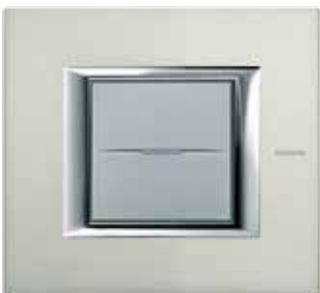
Brushed aluminium - XC