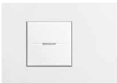
White Mat - AW