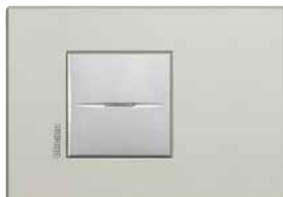
Sand - SB