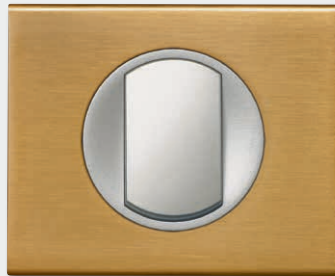
Brushed Gold Metal