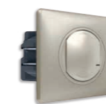
Συνδεδεμένος διακόπτης με δυνατότητα dimmer Titanium/Titanium