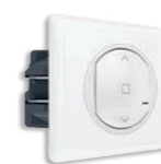
Συνδεδεμένος διακόπτης ρολών White/Yesterday White