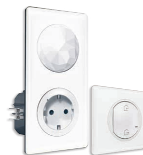
Βασικό kit εγκατάστασης White/Yesterday White