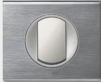
Brushed Stainless Steel